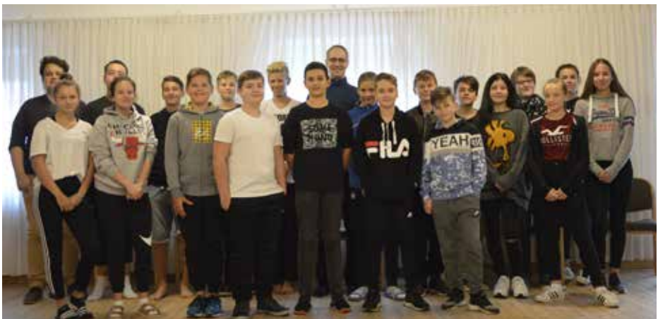
Konfirmanden 2018/2019 auf der Konfifreizeit

Der nächste Drive & Pray Jugendgottesdienst findet am Freitag 30. November 2018 um 19.00 Uhr in der Martin-Luther-Kirche in Vöhringen statt. Dazu sind wieder alle Konfirmanden und Jugendlichen aus der Illtal-Region eingeladen. Thema des Gottesdienstes ist „Verwählt?!“.